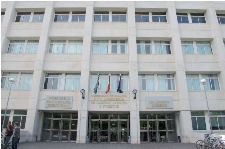
Escuela de Granada en el Campus de Fuentenueva