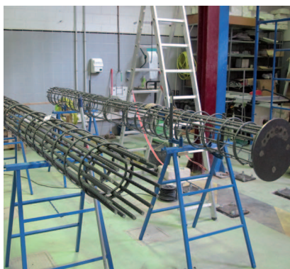
Laboratorio de mecánica de estructuras

Para conseguir acuerdos de doble diploma con centros de prestigio, están muy avanzados los acuerdos con dos centros: INSA-Rouen y ENISE-Saint Etienne, ambos en Francia. “Esperamos poder concretar para el próximo curso estos acuerdos, que seguro nos abrirán nuevas posibilidades con otros como INSA-Estrasburgo, que ha mostrado también interés en ello. Se pretende igualmente abrir líneas de colaboración con centros en otros países, no necesariamente europeos”, explica la directora.