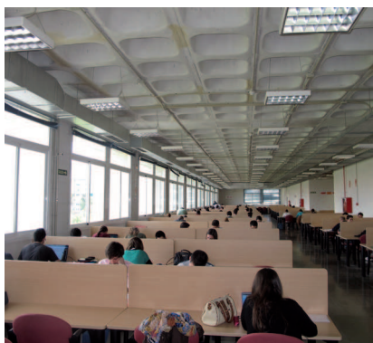
Sala de estudio

Las prácticas externas, académicamente planificadas y supervisadas, han constituido y constituyen un elemento formativo fundamental del modelo educativo de la Escuela. “Son consideradas como una oportunidad estratégica para enriquecer la formación de sus alumnos y mejorar sus posibilidades de acceder al mercado laboral”, añade la directora.