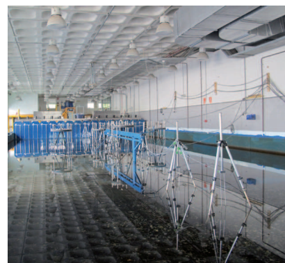
Laboratorio de ingeniería hidráulica

En cuanto a la búsqueda de estrategias que permitan incrementar la demanda de títulos que la Escuela oferta, “se considera muy importante que nuestros planes de estudios sean más atractivos a los estudiantes. La oferta que existe en la actualidad en España, y concretamente en Andalucía, en materia de Ingeniería